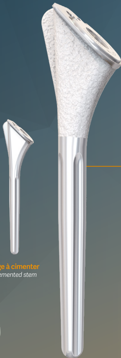
Tige à cimenter Cemented stem